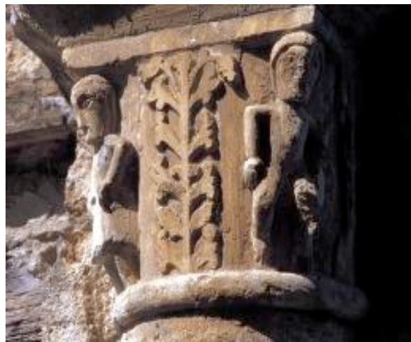
Fig.1 Capitello dell'arco d'entrata al chiostro a Santa Maria a Conè

di una semicolonna di un arco, impostato giusto adiacente al fianco destro della chiesa, dal quale s'accede al chiostro attorno a cui le strutture del monastero si sviluppano. Ivi, sono scolpite due figure: un uomo, ben riconoscibile dal sesso appena abbozzato, cosa già strana per l'arte lombarda del XI secolo, ed un donna, riconoscibile invece dall'assenza di barba e dall'acconciatura 3 .