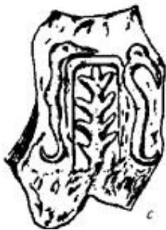
Fig. 3 Frammento di un sigillo vicino orientale recante l'albero della vita (sotto)

le. Il culto dell'albero come simbolo di abbondanza è difatti noto dai lapponi, sino agli Indiani, dagli Scandinavi sino i Persiani, dagli Italici ai Greci. Ma ancor prima di esser simbolo di ricchezza l'albero è simbolo della trascendenza: legame tra i due mondi, tra cielo e terra, che affonda le radici nell'uno e staglia le punte nell'altro. È poi simbolo generativo, simbolo del progenitore per eccellenza, sotto il cui ceppo nascevano i bambini sia nella tradizione